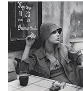
Günter Rössler, Budapest 1974