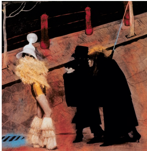
Narrenschanzen - Hommage à Feininger , 2005 Foto © Karl Lagerfeld

Die Ausstellung ist die erste umfassende Werkchau zur Fotografie Karl Lagerfelds nach dessen Tod im Februar 2019 und präsentiert seine vielfältigen Interessensgebiete, darunter Architektur, Landschaft, Abstraktion, Porträt, Selbstporträt und Modefotografie – sowohl seine Werbekampagnen als auch Editorial-Shoots für bedeutende internationale Modezeitschriften. Einige der ausgestellten Werke sind erstmals überhaupt öffentlich zu sehen! In der Schau kann man aber auch die künstlerischen Referenzen entdecken, die Lagerfeld in seinem fotografischen Werk interpretiert und transformiert hat – von Oscar Wilde, Eduard von Keyserling, Ovid und Longus, über die Gemälde von Lyonel Feininger, Vilhelm Hammershøi, Edward Hopper und Florine Stettheimer bis zu den Filmen von Fritz Lang und den Fotografien von Edward Steichen und Baron Adolph de Meyer.