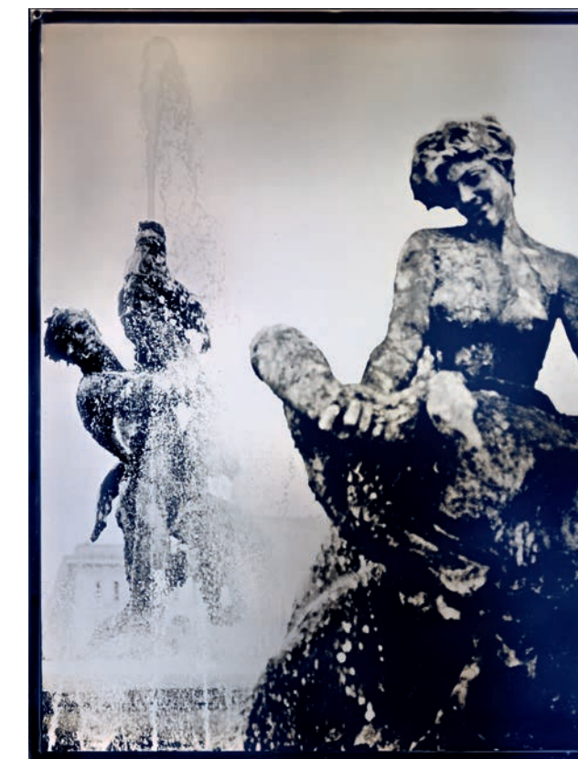
The Glory of Water , 2013 Foto © Karl Lagerfeld