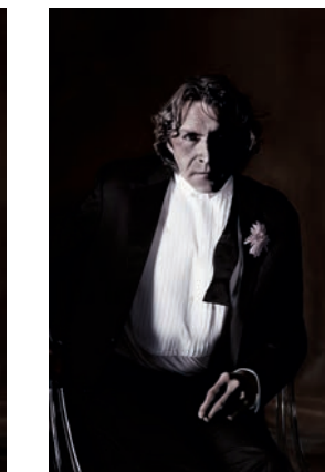
A Portrait of Dorian Gray , 2004

Ich kann das Leben nicht mehr ohne seine Abstraktionen betrachten. Ich betrachte die Welt und die Mode durch das Auge der Kamera. Das gibt mir bei meiner eigentlichen Arbeit eine kritische Distanz, die mir mehr hilft, als ich jemals für möglich gehalten hätte.