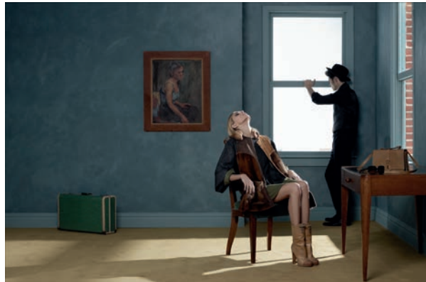
Suite 3906 , 2010