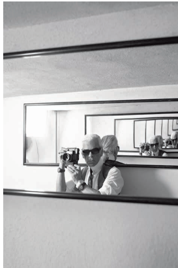
Selbstporträt, 2005 Foto © Karl Lagerfeld

Der Modedesigner, Fotograf, Buchverleger, Karikaturist und Filmregisseur Karl Lagerfeld (1933–2019) verfügte über ein ganzes Universum künstlerischer Ausdrucksmöglichkeiten. Aus seiner stark ausgeprägten Intuition, seiner nie ruhenden Kreativität und seinem außerordentlich wachen Verstand entwickelte Lagerfeld einen ganz ihm eigenen, stark strukturierten und auf die große Inszenierung gerichteten Stil, den er jederzeit und in jedem künstlerischen Medium gültig ausformulieren konnte.