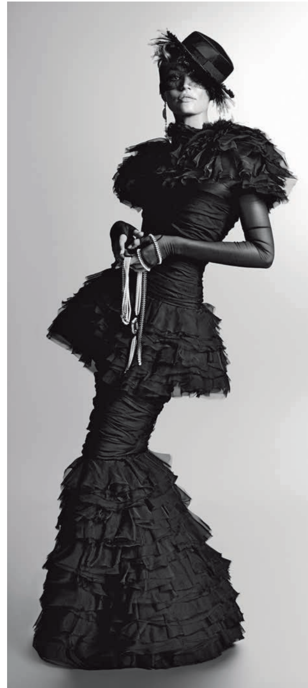
Candice Swanepoel, Harper's Bazaar , 2011

Der zentrale Ausstellungsraum in der sogenannten Westbox des Museums verwandelt sich für die Zeit der Ausstellung in einen Parcours seiner schönsten Modefotos, während im Innenhof der Moritzburg in einer einzigartigen, auf den Ort zugeschnittenen Inszenierung Selbstporträts des Künstlers den Besucher willkommen heißen.