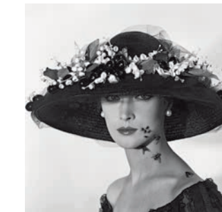
Guy Bourdin, Vogue Paris, April 1959