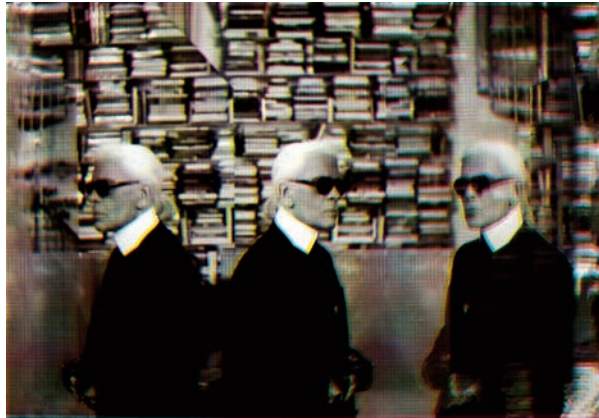
Selbstporträt, 2007